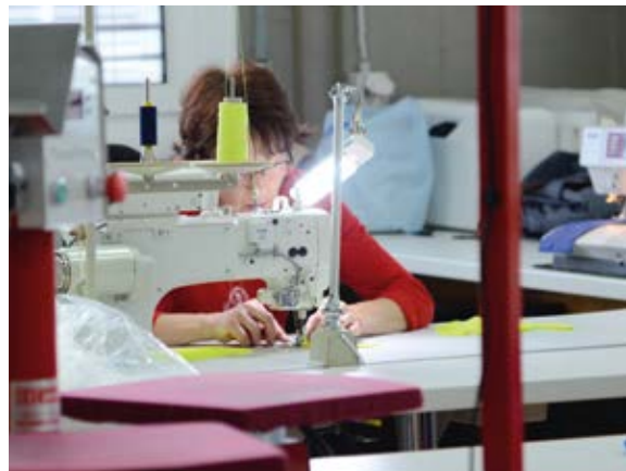
Bei ganz besonderen Anforderungen greifen wir zur Nähmaschine.